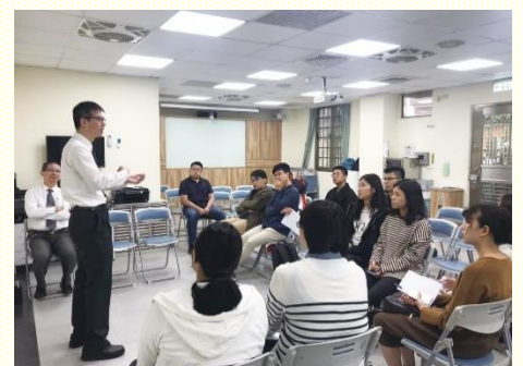
畢輔園就業組交通

聚會的一開始，就以二〇一四年夏季全時間畢業詩歌『蒙召者』作開頭，詩歌說到：『拼上！傾倒全人；主，踏過我！為你榮