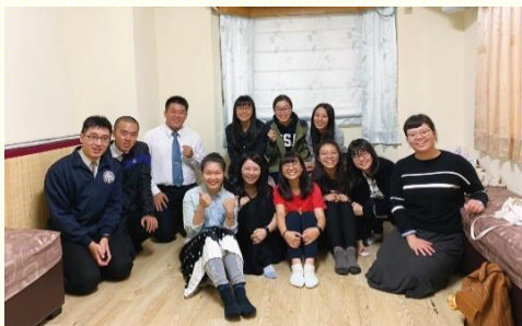
畢輔團訓練組會後合影

主 已經呼召我，心裏也對參訓有渴慕，但時間一久，仍是時常充滿猶疑和計算。很感謝主，即