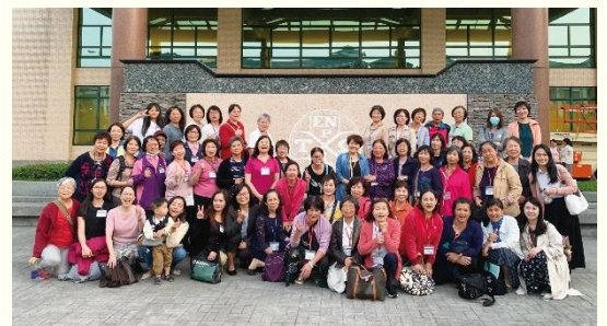
南區姊妹們會後合影

主也給我們特別的恩典，第一梯次的第一堂聚會，便邀請來自桃園的姊妹分享追求李常受文集的蒙恩。有姊妹見證，在現有的生命讀經進度中，再加上李常受文集的追求；另有姊妹交通，在不同的