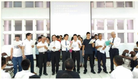
各區詩歌展覽並分享見證

看見一班喜樂的基督徒，就好奇他們為何能滿了喜樂。於是繼續與他們聚會，纔發現原來他們裏面有一股永不乾涸的活泉，使人滿足歡暢。而這永不乾涸的活泉，就是主自己。現今他能見證，因着飲於這活泉，能以享受真正的安息與喜樂。