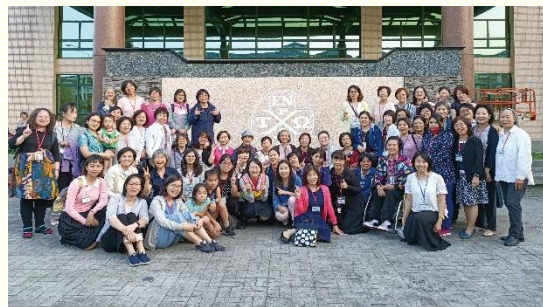
北區姊妹們會後合影

為 着一個新人，我們都需要達到長成的人，達到基督豐滿身材的度量。以弗所書四章十五節：『惟在愛裏持守着真實，我們就得以在一切事上長到祂，就是元首基督裏面』。我們都需要在一切事，就是每一件事，無論大事、小事上，長到基督裏面。這節提到的