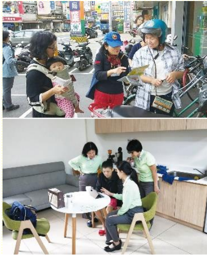
十六會所聖徒與學員傳福音

感 謝主，能有機會和壯年班學員一起開展。第一天報到時，請路人幫他們在會所門口拍照，之後請那人進來並向他傳福音，這人就得了！還有一次晚上，和學員們到一個奶奶家傳講人生的奧秘，就直接為奶奶受浸，成為我們主裏的姊妹。最後一天的福音聚會前，主仍帶領我們到一位年邁的福音朋友家，我們抓住機會，這位年長弟兄也單純的在家中受浸，太喜樂了！