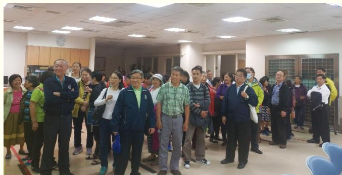
壯年班開展出發前編組

這次福音開展，主賜給南區各會所前所未有的同心合意的靈，我們喜樂撒種，歡呼收割。眾人經歷基督的身體，乃是新婦軍隊，威武如展開旌旗的軍隊；我們倚靠身體，在基督的得勝裏誇勝。讚美