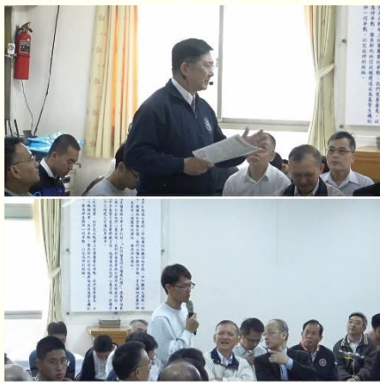
弟兄交通家聚會負擔並分享見證

經過交通，我們邀到新北市召會三十四會所汐止中興區的洪弟兄，帶着聖徒們一同來本地，為我們在家聚會的實行上再有開啓。十一月十日主日擘餅後，洪弟兄向我們娓娓