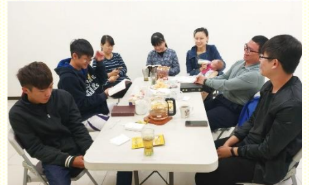
青職於家中或會所聚集