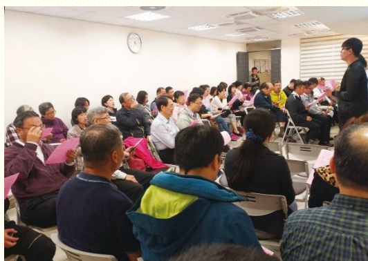
東照顧區青職福音聚會

歡唱與弟兄們的見證分享，讓眾人享受主就是那真光，指引我們走人生的道路；並享受主就是那活水泉源，解我們的乾渴。最後藉着短講、呼召及受浸陪談，有三位願意受浸歸入主名，感謝主！在身體的配搭裏帶下神的祝福。(六會所 游兆宏弟兄)