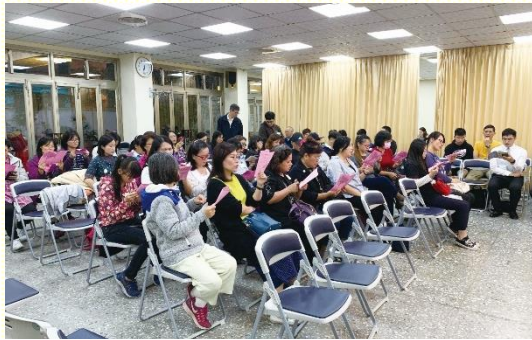
中照顧區青職福音聚會

堅定持續為這聚會禱告，為邀約人禱告。聚會當天，聖徒不分男女老幼，皆前去邀約中平街上的年輕人。這次的福音聚會如同開展行動，社區聖徒都能一同開展。