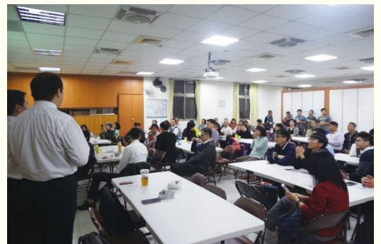
西照顧區青職福音聚會

聚會前的一個月，就將各會所的福音朋友名單列出，週週在禱告聚會中為每一位福音朋友代禱，讓聖靈動工。