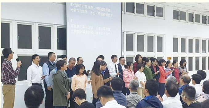
北區青職福音聚會歡唱詩歌

從交通出福音聚會的負擔後，於十月二日起，青職們以及對青職有負擔的聖徒，每週聚在一起有多而又多的禱告。不僅有集中在一會所的禱告，各會所於主日會後也為青職福音有迫切的禱告。