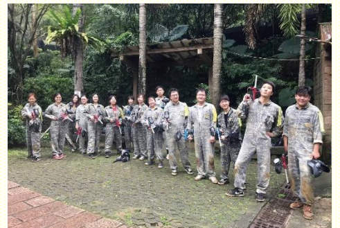
青職們相約戶外打漆彈相調

其次，在十一月二十三日的早上，為配合北區青職福音行動，我們安排青職們邀約福音朋友一同外出，先去打漆彈與烤肉，有些人性顧惜的相調，參與人數共三十五人，青職參加人數二十七人，其中福音朋友四人；下午我們也邀到二位福音朋友，一同參加福音聚會。此次福音聚會的方式較特別，是北區各會