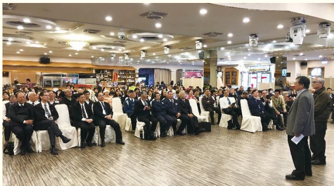
聖徒見證在成全聚會中得到的幫助

的是『主動操練』。歷史班藉由召會歷史得知，如何長久留在召會中，祕訣就是沒有野心，要清心，單單要主。書報班是從腓立比書來看如何經歷基督，首先是在我們的靈裏，然後不是在聚會中，乃是在生活中經歷；藉着一些的環境，使我們顯大基督而活基督。而讀經追求方面，詩篇則是將我們從個人對人事物的反應中，引到對基督、召會、神的國的實際裏。