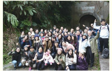
聖徒們元旦晨興合影

在這段個人禱告的時間，早已忘了外面寒風的吹襲，裏面飽享主暖暖的愛，這一刻真經歷主愛的激勵，離主好親、好近。