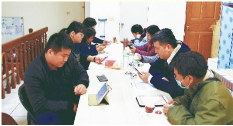
禱告聚會中追求職事的話

從二〇一八年一月三十日迄今，已追求六十篇的信息，幫助我們在主日聚會作祭司事奉，在召會生活中過國度生活，在日常生活中接觸人並傳揚福音。因此，