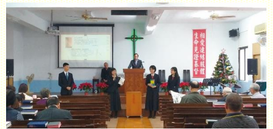
壽山長老教會分享書報

感謝主的祝福，許多渴慕主話的人向我們敞開。其中一位原住民教會的牧師，還鼓勵大家讀恢復本聖經，也有多人購買十大好書，使我們大得激勵。