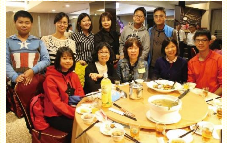
歡喜用餐喜樂合影

舉辦兩天的兒童品格園，青少年有二十位配搭隊輔、社區聖徒有四十位服事，占全會所主日人數的百分之七十，並得着