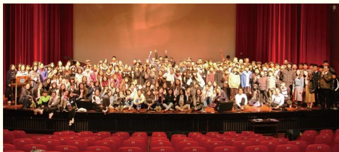
中學生寒假特會合影