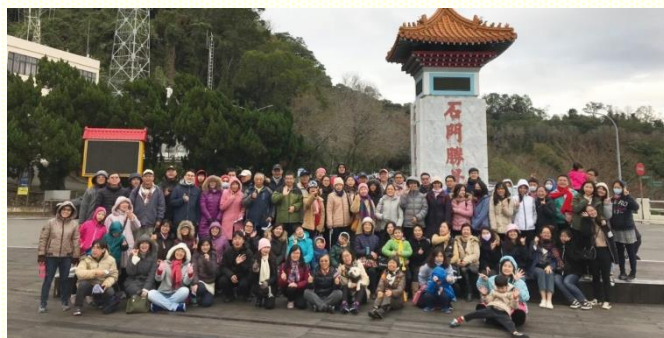
齊聚石門壩頂晨興合影

晨興使我們養成一早遇見主的習慣，藉着讀主的話，享受屬天的嗎那與清晨的甘露，得着生命的供應。如詩篇一百一十九篇一百四十七節：『我趁天未亮呼求；我仰望了你的言語』，又如約翰福音六章五十一節：『我是從天上降下來的活糧，人若喫這糧，就必永遠活着』。『晨興是活力的泉源，禱告是能力的來源，相調是動力的根源』，這是召會生活得勝的祕訣；也是『新人走新路，新路得新人』的具體實踐。