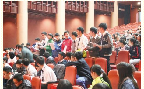
青少年在課堂中操練分享

這 次十會所與我一同參加特會的同伴變多了，我的心中充滿喜樂！藉信息的餵養，我最摸着兩個大點：第一、清理舊生活得以重生。從前的生活樣式使我與主之間有間隔，很難從習慣中轉向神；但主是信實公義的，只要我願意，祂必體恤我的軟弱。在禱告中，我對主說：『主，我不想再回到以前。更新我的心思，我想要有與你調和的神人生活』。