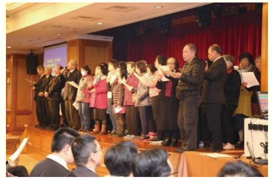
年長聖徒展覽臺語詩歌

兄姊妹的分享，只要在基督裏，日子如何，力量也必如何，在他們受限的體力中，看見主的無所不能！所有的見證分享都讓我們看見，神的眷顧與主甜美的同在，這真是一個榮耀的日子！