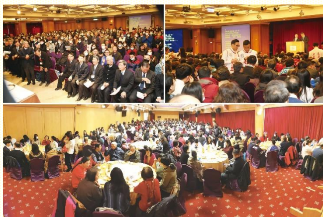
北區新春特會於住都大飯店舉行，會後歡喜用餐

是說，我們在日常生活中，全人都應讓祂完全佔有，使祂成為我們的一切。我們也應當留意不要愛世界和世界上一切的事，要恢復起初的愛，並要將在我們裏面父的愛流露出去。不但愛我們的弟兄姊妹，更要寬廣到一個地步，感覺每一個人都是可愛的。而作主工的人必須滿有父神愛和赦免的心，以及救主基督牧養和尋找的靈；需要藉着這樣牧養的靈，不將人分類、也不去定罪任何人，以滿了愛和關切的心來建立活力排。