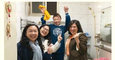
弟兄的妻子也受浸得救

在一次叩門中，我們遇見一位先生，一進門就向他傳講受浸真理。當下，就在他家中的浴缸為他施浸。我們對他的妻子得救也很有負擔，聖徒們在回訪的過程就為這個家運用升天的權柄禱告，這位弟兄的妻子在兩週之後也得救了！夫妻兩人一同有分於福音聚會與主日聚集，並於二月八日除去家中的偶像。讚美主，使我們得着這個完整的家。