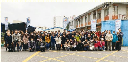
第四週開展桃園大專生配搭叩門前合影

每次出訪前同心合意聚集一起，喜樂的唱詩禱告；一面我們爭戰據有美地，一面在接觸人的方式上彼此成全。