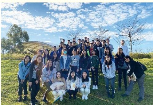
於新勢公園戶外晨興

週規律的時間表安排，使大專生的生活作息回歸正常，也能與同伴多有交通與相調，為着開學的期