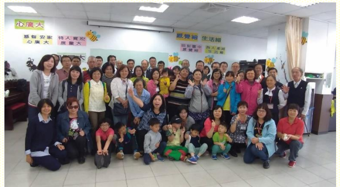
會所增區前外出至十四會所相調

藉着十月下旬，壯年班學員前來開展，全會所聖徒齊心配搭，眾人如同一人。大家一同爭戰，同吹一個增區的號聲。感謝主賜給我們十個果子，和