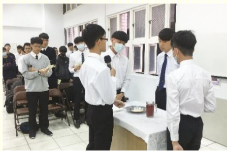
高中弟兄們祝謝禱告

在 這次期初福音特會的前幾天，被服事者告知要配搭擘餅聚會祝謝禱告的服事。當下真的非常緊張，因為這是我第一次在特會中，在那麼多人面前禱告。