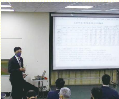
臺北弟兄交通負擔

以上所說的每一句話，都深深印在我們心裏。主！我們願意領受負擔，走新路，為召會的繁增重看家聚會，更為召會年輕化加強作青職。我們