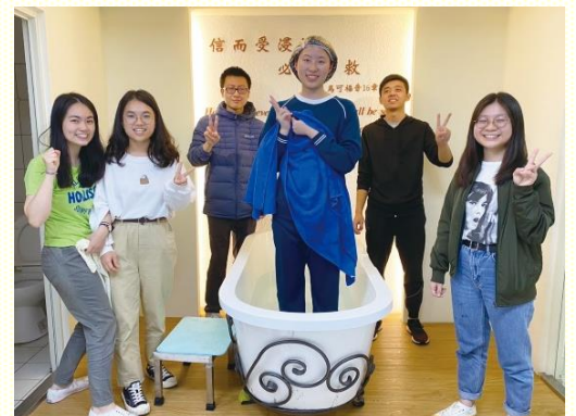
中原大學開展帶人得救

在整個福音節期裏，各校總共得了十五個果子，阿利路亞。實在是主的恩典與祝福！求主持續加強大專生裏面牧養的負擔，讓這些平安之子藉着餵養成為常存的果子。在接下來的福音行動中，也求主去除一切