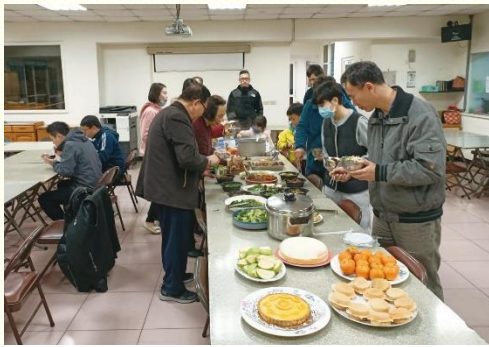
邀約青職享用愛筵

藉着弟兄交通的幫助，泰山區從三月十三日週五晚上，開始有為青職擺上愛筵的交通聚會，又稱為『筵宴之家』。期望在用飯相調中，讓人看見召會生活的小影；不僅有馬大在復活裏的殷勤服事，拉撒路死而復活的見證，還有馬利亞因愛主傾倒香膏的香氣。一開始聖徒們先列出區裏的青職名