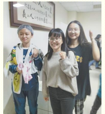
中央大學開展帶人得救

朋友，從一開始在路上傳講、電話回訪、邀約，直到與社區聖徒配搭呼召受浸，過程中我們不斷為這位福音朋友的得救禱告。由原本的不願意、掙扎抗拒，直至最後聚會時的感動而受浸，真是經歷主復活的大能。