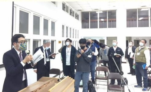
北區弟兄事奉集調

此次春季國際長老及負責弟兄訓練因疫情嚴峻，改在各大區辦理，故能蒙恩的弟兄們加多了。已往到中部相調中心，北區大約七十位弟兄參加；這次在本地的一會所舉辦，共報名一百七十四位，三天下來，每天最少有一百零九位、最多也有一百二十五位，一同接受神話語的分賜，進入全臺眾召會一道的水流裏。