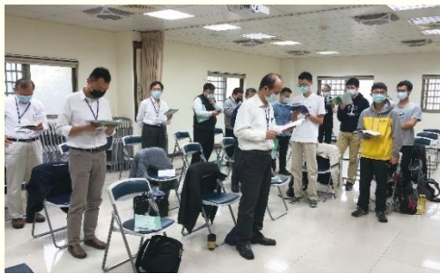
十會所的弟兄事奉集調

很 享受第一篇信息，說到『神在宇宙中旨意的奧秘，至終是要藉着召會作基督的身體而將萬有在基督裏歸一於一個元首之下』。有幾個關鍵辭是我們應該注意的，包括『旨意（意願）』、『定旨』、『喜悅』、『決議』、『經綸』等，除了要明白並分辨其中的含意，還要知道這些都不是神外面的作為，乃是