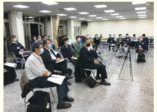
二會所的弟兄事奉集調

主藉弟兄們的說話。如此，雖然聚會分散在三個場地，卻都進入同一個說話。每篇信息之後，弟兄們分