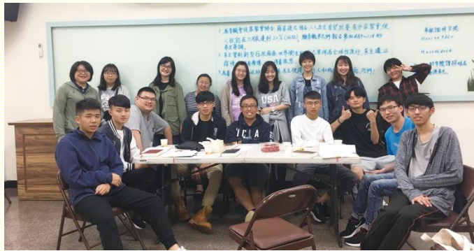
得救新人參加小排

開學當週，學生和社區聖徒每天都到銘傳大學校園附近，發單張接觸學生。雖然學生們還願意接受福音單張，但相較已往，不容易有一對一的傳講。因此，鼓勵每位住在弟兄姊妹之家的學生，為自己的同學題名禱告，每週發五張單張給同學，操練傳講並邀約同學參加真理講座。在每天為校園