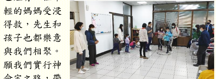
兒童親子福音活動