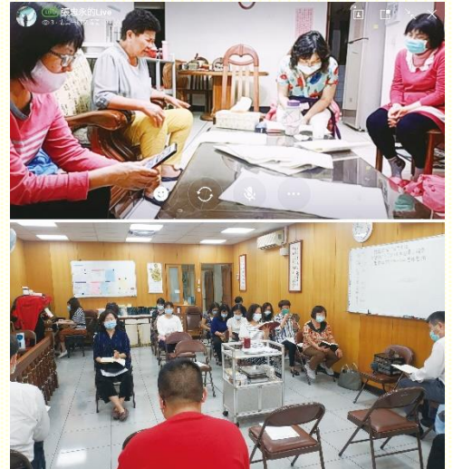
小排直播畫面及聚會直播情形