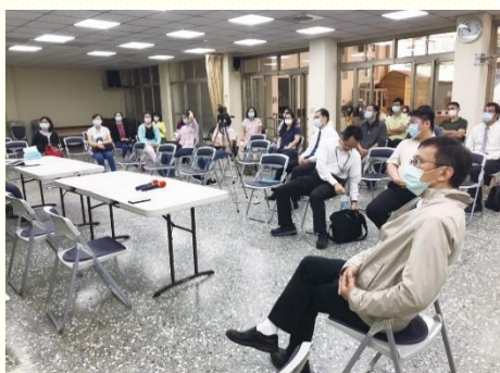
南區中學生家長與服事者成全聚會

一開始擔任輔導老師的弟兄，分享如何與中學生溝通良好的方式。現今的中學生，是在網路世界中找答案。面對這樣的孩子，服事