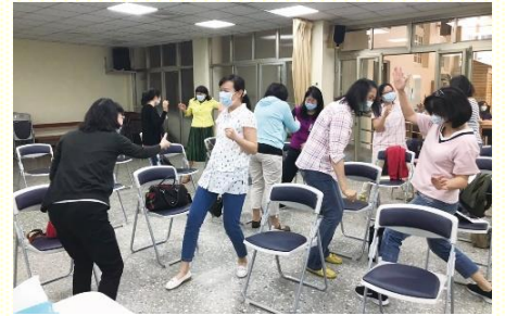
聚會安排體驗活動