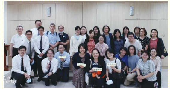
北區中學生家長與服事者大合照