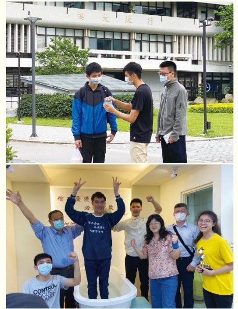
大專生傳福音帶人得救