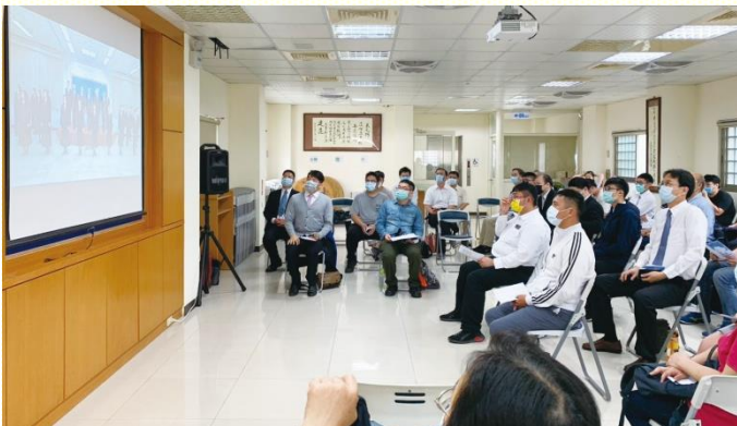
南區秋季班呼召聚會網路直播

今年秋季班呼召聚會的網路直播，南區青職場於五月二日週六早上在十會所舉行，共有五十位弟兄姊妹參加，其中包含三十三位青職聖徒，以及十七位陪同者。因疫情的關係，原本在訓練中心舉辦的呼召聚會，調整成線上直播，願意參訓的聖徒就在各地報號。感謝主看顧並保守這場聚集，讓聚會的負擔傳輸與見證分享，不受打岔，並且參與人數比起已往現場聚會人數更多，加倍蒙恩。