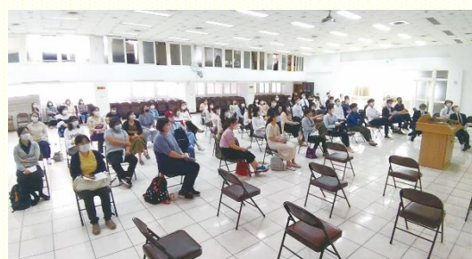
北區秋季班呼召聚會網路直播

愛主的心。所以我們需要奉獻時間，接受訓練，受主成全為主所用，為着建造而起來爭戰。