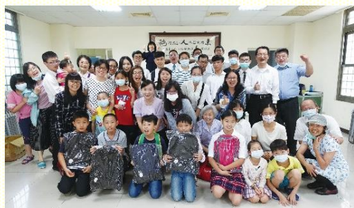
受浸聚會喜樂合照

今年五月三十一日本會所舉辦了大兒童受浸聚會，共有五位兒童受浸。為着加強孩子們藉認識真理而經歷神聖的遷移，在聚會以先，請家長分別時間陪伴孩子，一起讀兒童受浸教材。受浸前有筆試與面談，並由服事者帶着孩子一同跪下