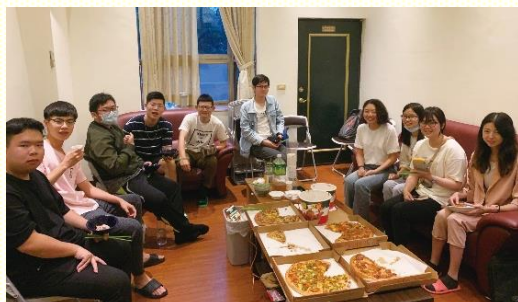
元智大學福音聚會合照

傳福音，是一人傳講信息，眾人在下面聽；現在藉着禱讀傳福音，讓大家一同開口禱讀而進入福音信息。這樣的實行比僅僅聽道更摸着人心。