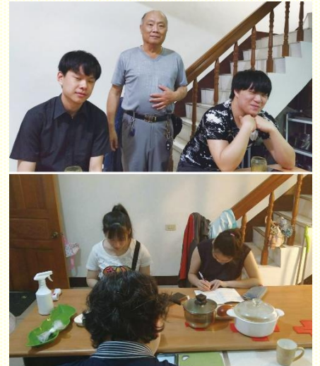
與大專生用餐並家聚會

其中有一位就讀開南法律系大三，久不聚會的學生，在會所附近租房子。因着負責弟兄帶領列名單禱告，我們夫婦常常為他禱告，對他很有負擔。有一天終於順利邀他來用餐，飯後邀他參加小排聚會。當