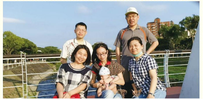
三民河濱公園接觸青職的福音對象

為了能堅定持續的實行傳福音接觸人的生活，我們找了一位弟兄作題醒人，週週在會所的羣組內發出訊息，呼召大家同去傳福音。週中禱告聚會時，也不斷鼓勵核心事奉的聖徒，邀約聖徒們一同散步，一同傳福音。過程中，我們把休閒運動、