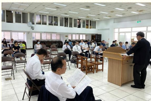
現場聚會聖徒分享

北 區的國殤節特會信息追求於五月二十九、三十日舉辦，主場在一會所，藉直播方式分在各會所進入。共有三堂聚會，每堂交通二篇信息，總題是：『關於世界局勢與主的恢復應時的話』。這是弟兄們向主尋求應時的話，要我們認識世界局勢是神在地上行動的指標。也要讓聖徒們看見神寶座的異象與世界局勢，知道每個人和每件事都在主手中。所以我們要以神為信心而恆切禱告，且願答應祂的呼召作祂時代的憑藉，就是祂的得勝者，以轉移時代；並成為羔羊的新婦，也就是祂所有得