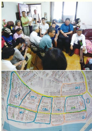
齊心禱告並規劃叩訪配置圖

會所目前有六個小區，自七月份開始，直到年底十二月，每個小區輪流開展一個月，其他小區一起前來配搭。藉着身體集中的力量，彼此相調學習，互相扶持鼓勵，既能兼顧區域特性又能擴大眾聖徒的生命度量。負責開展的小區規劃叩訪區域之街道配置圖，