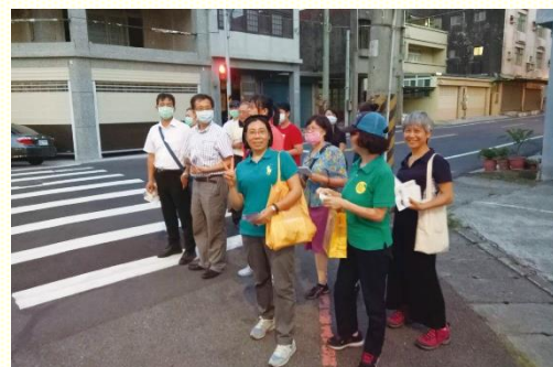
各地聖徒一同配搭傳福音

家找機會操練傳講福音。學習謙卑順服，彼此同心合意，讓人人都能擺上自己作主合用的器皿。