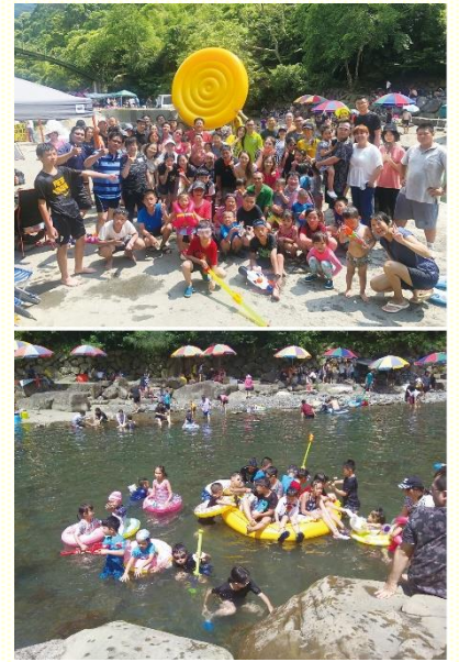
孩子們享受溪水並喜樂合照