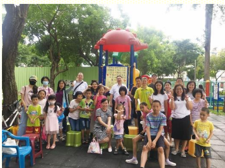
文化公園兒童福音

因疫情影響，原定四月份的開展延至六月，在那段期間，十會所的聖徒們週週在禱告聚會中列名單為人禱告。等到壯年班開展隊來了，弟兄姊妹已累積約五十人的名單，這些熱門名單都是可以和學員一同看望並收割的。