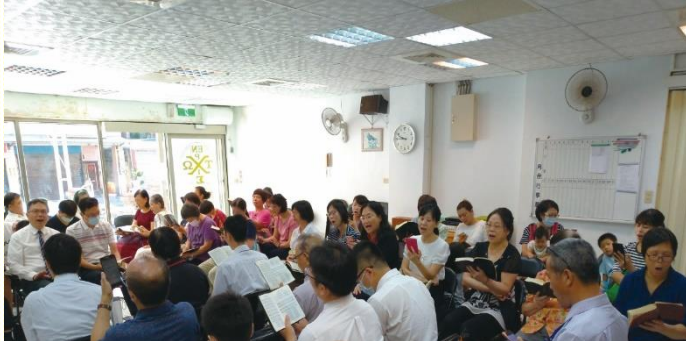
與二十三會所聖徒主日相調

當天主日聚會，大人和兒童人數約有五十多位，其中還包括了一對新調動而於該會所服事的全時間夫婦的家，以及他們剛得救的父親。聽大家分享得知，這個家昨天纔在弟兄姊妹的扶持幫忙下，