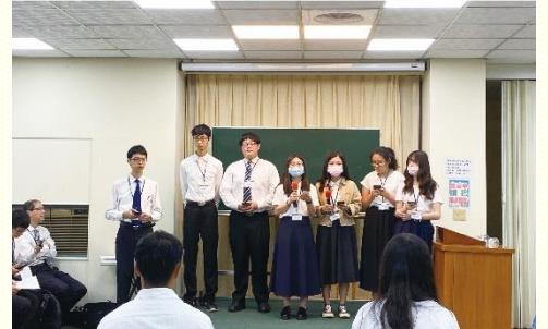
(上)高三畢業生同唱詩歌 (下)大專學長姊上臺作見證