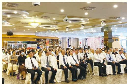
聖徒成全期末展覽現場