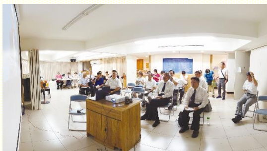
十八會所錄影訓練

這次的主題是『耶利米書與耶利米哀歌』的結晶讀經，實在摸着耶和華是心裏柔細的神；在心裏柔細這點上，耶利米與神完全是一。因此，神能使用申言者耶利米這位得勝者來彰顯祂，為祂說話，並特別在他的哭泣上