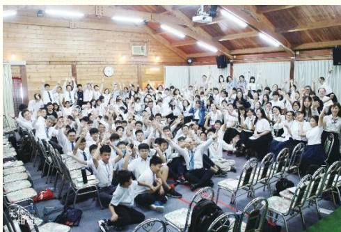
中學生暑期特會合照

拔高心志，過聖別的生活』。更以四個專題加強、幫助青少年，在生活中實際操練。其中特別在禱讀的操練上，帶