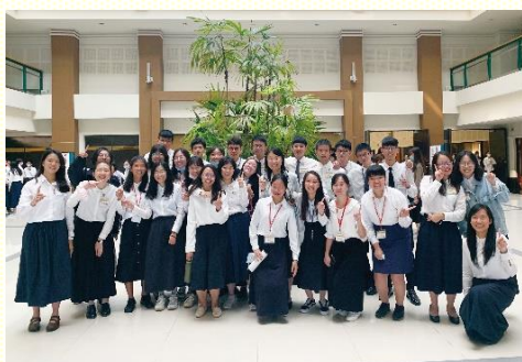
桃園與會大專新生

『入住弟兄姊妹之家的異象』、『如何讀書與選課』、『作神福音勤奮的祭司』等。也從舊約聖經的四卷書來看