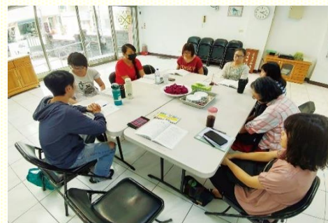
一同禱研背講進入結晶讀經

週週與聖徒們以禱研背講的方式進入結晶讀經，覺得非常享受，也贖回我們的光陰。在弟兄們的帶領幫助下，我們操練