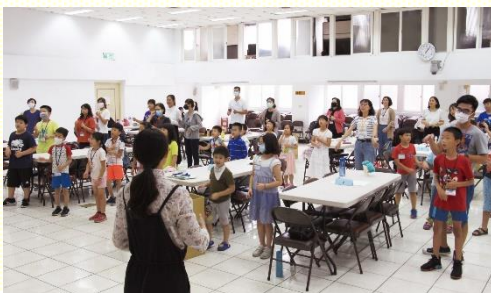
一會所品格園詩歌帶動唱

配合會所的福音行動，主動接觸孩子與家長，以進行邀約。主真是聽了禱告，陸續將報名的人數加給