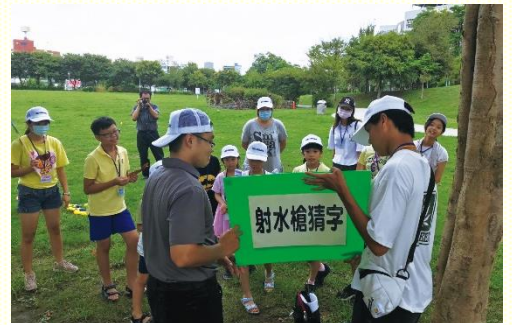
新勢公園進行活動