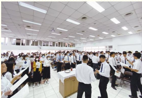
期初特會唱詩操練靈

今年中學生期初特會於九月六日上午在一會所舉行，共有二百三十三位青少年參加，以及九十六位家長與服事者一同配搭。本次特會的主題是『對耶利米書中神聖分賜的享受及其應用』，在主日擘餅聚會中，青少年們用靈唱詩讚美神，主將眾人的靈如火挑旺起來。接着有近三十位的青少年分享『高中聖徒一週成全訓練』及『暑期生活』蒙恩見證。青少年在一週訓練的幫助下建立了讀經及神人生活，藉着不斷的操練靈、轉向主，他們突破自己的天然個性，開口釋放靈禱告，看見『在人不能的，在神凡事都能』；也學習與同伴一同配搭，為福音迫切禱告，並放膽傳揚。