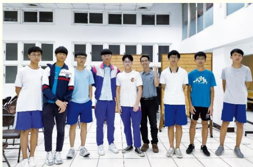
九月十七日福音聚會帶人得救