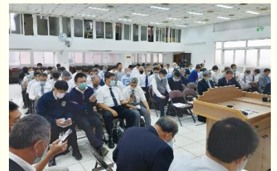
北區弟兄相調特會

領祂恢復裏的召會進入祂來的感覺中，因為她愛祂』。當祂對恢復的召會說我必快來，不僅僅是一種豫言，乃要激起一種嚴肅、細緻、內裏