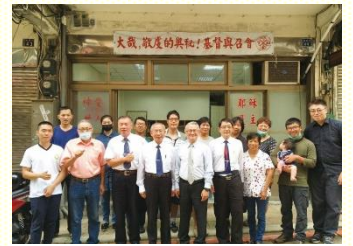
同工弟兄們訪問交通

這幾次的開展行動，有以下幾點蒙恩：第一，藉着不斷禱告交通，使來自各地召會的聖徒，能同心合意配搭並帶下祝福。第二，馬祖居民經營民宿或小本生意