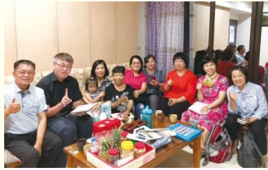
探訪恢復的姊妹及家人

南竿於二〇一七年開始有擘餅聚會，二〇一九年五月在聖徒的扶持下租了會所。但在此之前，馬祖的弟兄姊妹們無處可聚會，也有些到其他團體去。所以這次相調行程，除了看望聖徒們禱告許久的熟門，以及轉介的福音朋友，並一起參加錄影訓練、傳揚福音、恢復久不聚會聖徒。