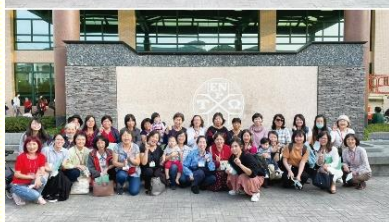
姊妹集調第六梯次喜樂合照

中，帶領聖徒們看見，主來的時候要像賊一樣，隱密的臨到那些愛祂的人，把他們當作寶貝偷去，到祂天上的同在裏。因此，我們需要做醒並豫備；若要被提，就需要先被屬天的氣充滿，在器皿裏盛着油；但若扎根在地上，天天被今生的思慮、屬地的享樂所霸佔，在那日就無法被提了。