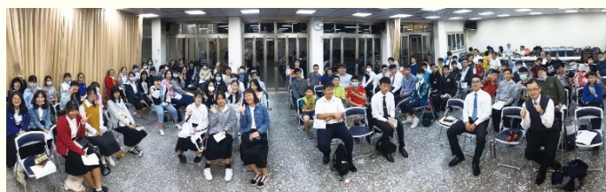
成全訓練後全體合影

第二堂信息為禱讀的操練。在已過暑期特會，服事者曾幫助青少年重複禱讀及加重禱讀，盼望