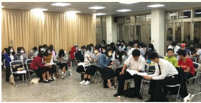
青少年兩兩操練禱讀

這次藉着活讀的操練，使大家學習不僅將主話應用到自己生活中；也能延續代禱小卡的負擔，將主話供