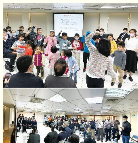
兒童展覽(上)及介紹新人(下)

主的桌子，個個肢體同心配搭建造。乃至青職聖徒承接託付，為全會所規劃二〇二一年周邊九個里的開展計劃，並吹號呼召傳揚福音。豐富的展覽實在出人意料。