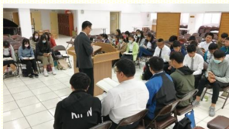
北區中學生成全訓練

已過十一月十四日週六在一會所，有三十二位青少年，參加北區中學生成全訓練，從早上九時至十二時共兩堂信息。因着察覺大部分青少年禱讀時，多半停留在公式化的重複禱讀，還無法從話中照着靈感而有活的發表；而在團體一面也因彼此不熟識，難以彼此堆加。因此在召會生活中，無論是排聚集或主日聚會，不易有拔尖的感受。除此外，在校園排中，雖然青少年邀來了同學，卻不曉得該如何向同學傳福音。為着他們的各面需要，此次成全負擔就放在禱讀及福音；不重在傳講信息，乃在於分組實際操練。