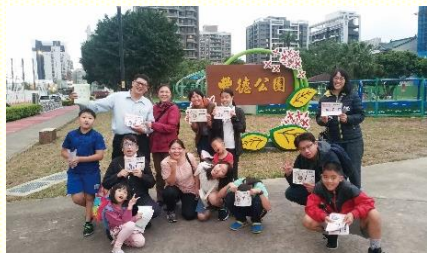
聖徒外出傳揚福音

收割聚會前兩天晚上與當天下午，眾人皆去到福音聚會的所在區附近，大街小巷，一隊一隊，出外訪人發放福音單張，邀約朋友前來參加福音聚會。如經上所記：『傳福音報喜信的人，他們的腳蹤何等佳美！』（羅十 15）。