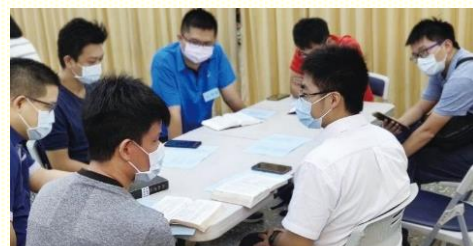
二會所青職小排福音聚會

中照顧區二會所的青職福音聚會，有兩個蒙恩的點：第一、青職聖徒主體拿起聚會服事。這次他們同有一個感覺，就是以小排方式讓人人操練傳講，也能增進與福音朋友的互動。第二、社區聖徒背後的禱告扶持，成為他們往前的最佳後盾。