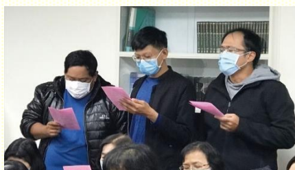
十四會所青職福音現況

東照顧區有位青職聖徒，對他以前的同學很有負擔。在特會後的每次晚禱結束前，總會題名為這位同學代禱。接近福音聚會時，特地到他家陪他聊天；最後不僅同學來參加聚會，還邀請了另外一位朋友同來。由此看見，需要常將關心的對象放在心上，如同舊約的大祭司，總是將胸牌放在心上，藉着烏陵、土明的尋求，關心神的子民。