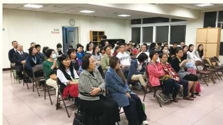
一會所青職福音聚會