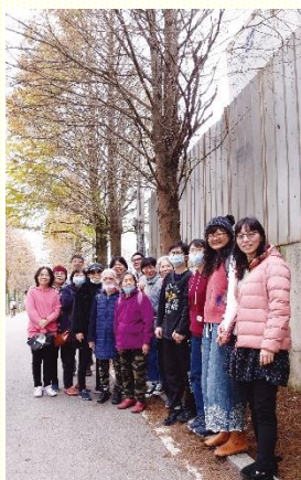
於落羽松步道合影

十時三十分抵達大溪的落羽松步道，到達時人潮已眾，處處停滿了車輛。有些落羽松雖然已凋謝，但在