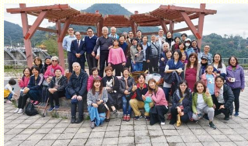
於石門水庫相調合影

調的活魚餐廳；不僅飽嘗肉質肥美的活魚，大家也一同數算恩典。用餐完畢，雨就停了；再前往石門水庫壩頂，觀賞湖光山色及秀麗風景。眾人各自攜帶下午茶點心，另有聖徒準備蘿蔔貢丸湯，為寒冷的冬天注入一股暖流。各式豐富的茶點美食，我們同享愛筵、同得飽足，更有分肢體間甜美的交通，因而經歷基督身體的實際。