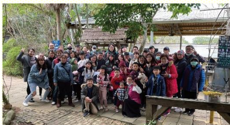
觀音區數算主恩聚集

聖徒對人的關心和負擔，深切期望參加的每一位，都能穩定聚會或回到神的家中，享受神恩典的豐富。