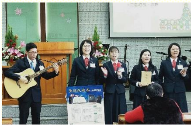
前往龍潭聖潔會推廣書報

另外在書報推廣期間，我們還經歷了從個人享受，到操練進入團體的爭戰禱告、禱讀恢復本聖經的豐富，而能團體的