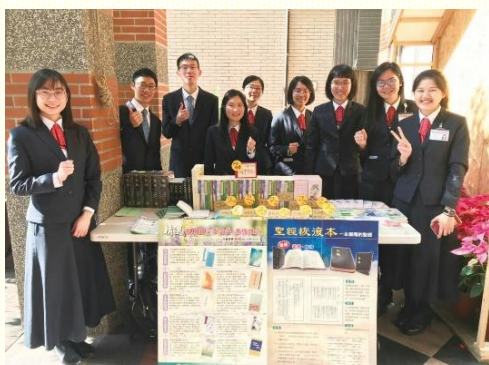
前往平鎮浸信會推廣書報

一開始推廣隊的時間表尚有許多空檔，於是眾人積極的聯繫與邀約，同時也出外走訪。只要在禱告的靈中，就是走錯了路，也有神的主宰。主帶領我們遇見一位王牧師，開