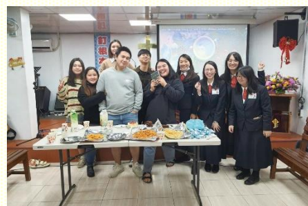
前往僑美教會推廣書報

在這次的書報推廣中，雖然經歷了高山低谷，但我們將各樣的環境帶到主面前去禱告，就蒙主光照，受主調整，