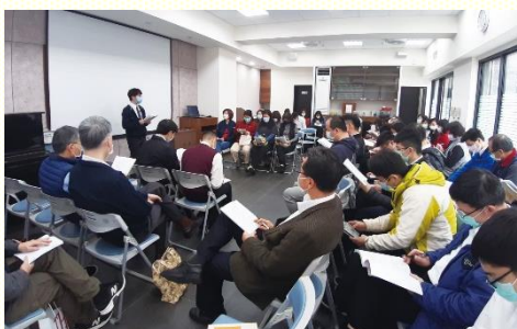
錄影訓練中弟兄帶領禱研背講

本會所的眾聖為着一同進入這麼豐富的信息，享受主話語的澆灌，沒有因為連續將近十天的聚會而有疲