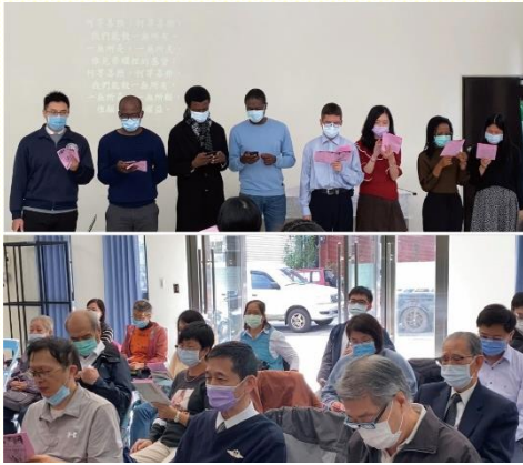
年終數算主恩聚會

興仁區暨高城區便選定去年十二月十三日，就近於篤行里活動中心舉辦年終數算主恩聚會。感謝主，藉着弟兄姊妹同心合意的禱告，列出名單並邀