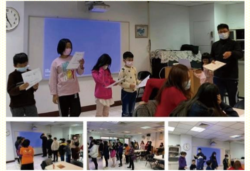
青少年生命教育福音體驗活動

自去年十一月份迄今，每月皆有一次青少年生命教育福音體驗活動；一次又一次的活動，不僅破除了青少年及家長對宗教的迷思，也讓他們看見原來生命的奇妙——來自這位宇宙的造物主，因而深獲大家喜愛。直到目前為止，每月的生命教育福音聚會中，皆有將近二十位青少年及家長參與。為此，我們對主滿了感謝與讚美，盼望主更深的製作並帶領他們，使他們藉着這樣的課程來認識這生命的實際